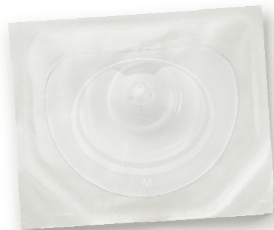
Embalado individualmente, estéril.